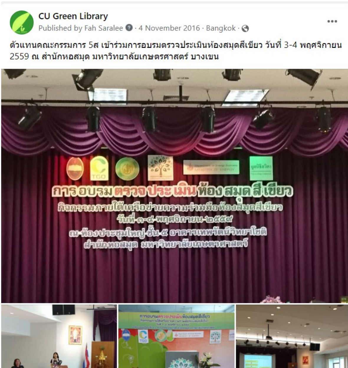
การเข้าร่วมเครือข่ายห้องสมุดสีเขียว